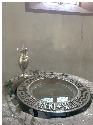
Tauf-Erinnerung am Ostermorgen in Nikolausberg

Aber Glauben ist nicht Sehen. Glückselig, sagt Jesus zu Thomas, sind die, die nicht sehen und doch glauben. Und das erfordert Mut. Martin Luther hat es so gesagt: „Glaube ist eine lebendige, verwegene Zuversicht auf Gottes Gnade“ (Vorrede Römerbrief). Anscheinend haben Christenmenschen zu allen Zeiten geschwankt zwischen Hoffen und Zweifeln. Und trotzdem festgehalten an der Gemeinschaft und die Auferstehung Jesu bekannt und das Leben gefeiert. Auch unser Predigttext im ersten Petrusbrief ist so ein trotziges Bekenntnis. „Gelobt sei Gott, der Vater unseres Herrn Jesus Christus, der uns nach seiner großen Barmherzigkeit wiedergeboren hat zu einer lebendigen Hoffnung durch die Auferstehung Jesu Christi von den Toten.“ 1. Petrus 1,3. Zuerst aufgeschrieben wurden diese Worte für Christen in Kleinasien. In der Gegend der heutigen Türkei. Ende des ersten Jahrhunderts. Sie haben wegen ihres Glaubens zu leiden. Möglicherweise eine der Christenverfolgungen im Römischen Reich. Jedenfalls werden sie angefeindet und müssen Spott aushalten als Christus-Gläubige. Eine Minderheit. Sie leiden nicht so sehr darunter, dass sie Jesus nicht sehen können. Eher sind sie deprimiert, weil sie anderen nichts Sichtbares zeigen können. Dass Jesus lebt und in der Welt ist, lässt sich nicht beweisen. Solches Leiden, solchen Spott kennen Christenmenschen auch heute.